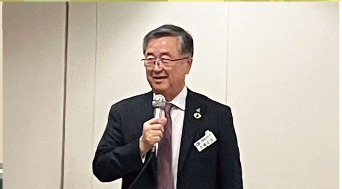
■武藤会員の進行で、充実した討論ができました。