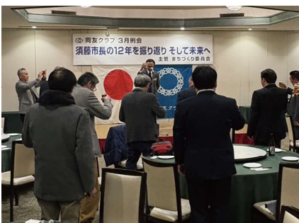
■懇親会は、須藤市長との語らいに、感謝と敬意が満ちた時間となりました。