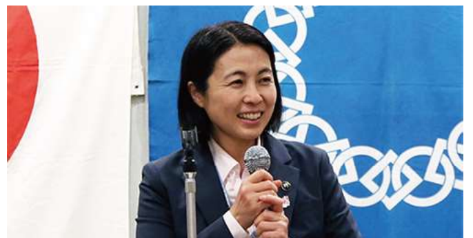
■筑西市の今後のビジョンを熱心に説明する設楽市長